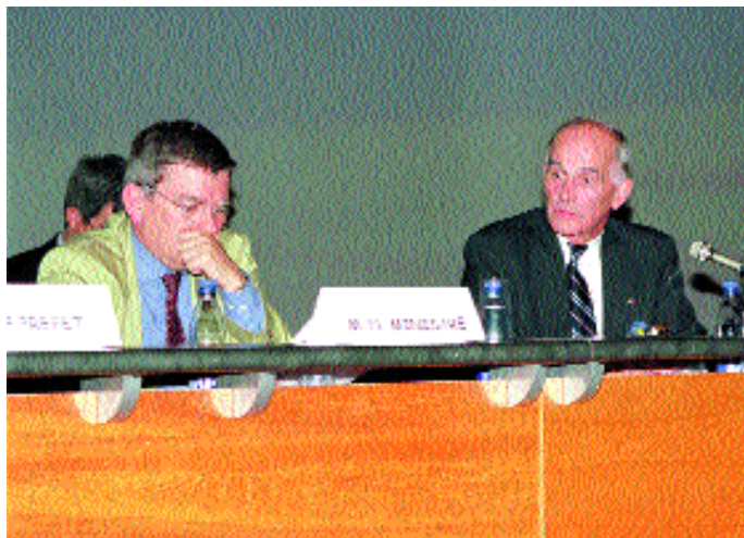
35 e congrès de l'AGPB le 17 juin à Strasbourg