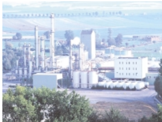
Unité de bio-éthanol BENP à Origny Sainte-Benoîte (02)

Sans abattement fiscal, les bio-carburants ne pourraient être compétitifs que pour un baril à plus de 70 €, se dit-il. Le vrai chiffre est moitié moindre. En outre, un litre d'essence "éthanolée" coûtera toujours moins cher budgétairement qu'un litre de super 98 non plombé par rapport à un super plombé. Encore moins que d'autres substituts des carburants, tels que le GPL, le GNV (gaz naturel-véhicule) et l'électricité (cf. les aides aux véhicules électriques et l'absence de taxes pétrolières sur l'électricité).