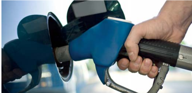
ORAMA demande la confirmation de l'exonération de taxe carbone pour les biocarburants

En principe oui, selon des assurances données à haut niveau à quelques responsables agricoles peu après la décision du Conseil constitutionnel. Mais les aléas de la vie politique peuvent passer par là. Fin septembre, souvenons-nous, le Président de la République avait affirmé lors d'une interview télévisée que les énergies renouvelables échapperaient à la taxe. Or, par la suite, les filières biocarburants ont dû batailler longuement pour obtenir gain de cause. Il a fallu des parlementaires particulièrement tenaces pour l'emporter