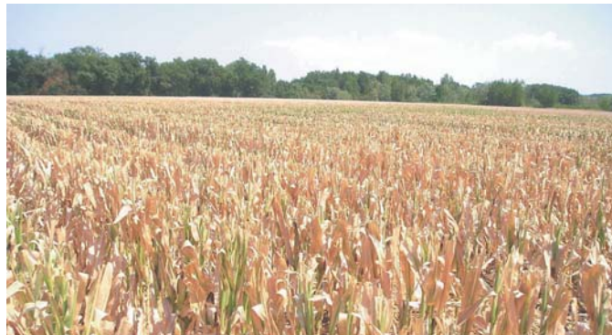
Sécheresse sur maïs semence.

Pour répondre, ORAMA s'appuie sur des indicateurs appliqués aux systèmes de culture des différentes régions. Ont ainsi été étudiés les niveaux de prime d'assurance