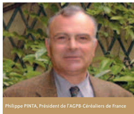
Philippe PINTA, Président de l'AGPB-Céréalières de France

Peser lourd syndicalement signifie que notre syndicalisme spécialisé doit se faire considérer comme le représentant incontestable d'un secteur qui fait produire et occupe 22% du territoire français ; qui, de la recherche à la première transformation et à l'exportation, en passant par les exploitations, la collecte, les transports etc, compte 275 000 emplois (35% de plus d'EDF-DGF ou PSA Peugeot Citroën ; 150% de plus que Total !), pour l'essentiel en milieu rural ; qui, sans cesse, investit, progresse techniquement et, sur le plan environne-