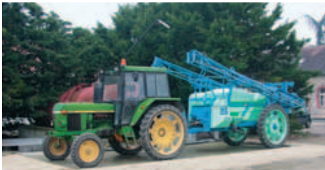
Poste de remplissage de pulvérisateur.

** Plan de maîtrise des pollutions d'origine agricole