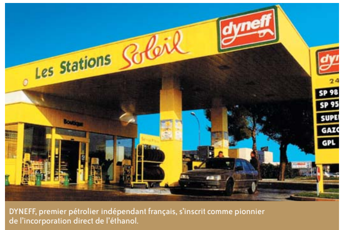
DYNEFF, premier pétrolier indépendant français, s'inscrit comme pionnier de l'incorporation directe de l'éthanol.

D'une part, l'éthanol est payé moins cher que s'il était incorporé en direct. L'industrie