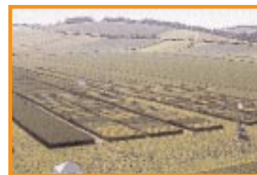
Du haut de la grande roue

Un village, animé par des sociétés de semences, de phytosanitaires et d'engrais, était par ailleurs implanté sur la parcelle depuis le 5 juin pour des journées réservées aux adhérents et, le 10, avec un matériel pédagogique adapté, ces sociétés ont joué le jeu avec le public. Certaines comparaisons étonnantes entre la toxicité naturelle des betteraves rouges ou du sel de table et celle des produits phytosanitaires ont ainsi permis à de nombreux visiteurs de réviser leur opinion sur ces derniers.